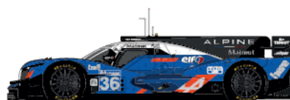
2016 - ALPINE A460