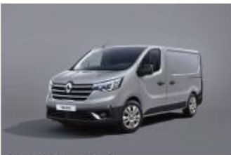
grigio magnete (vm)